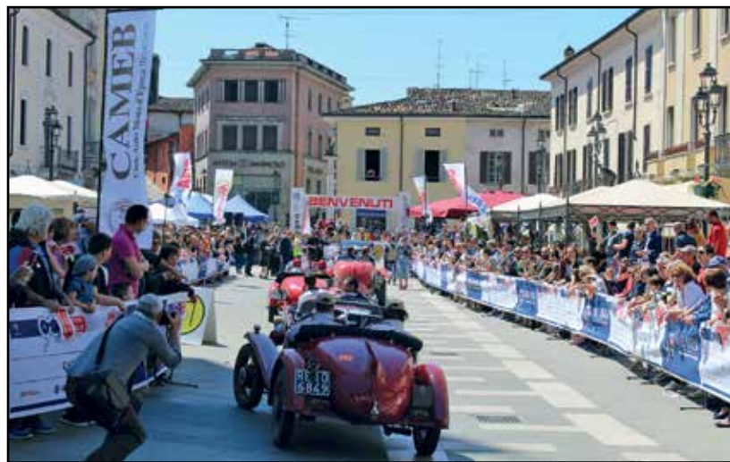
L'arrivo della Mille Miglia a Montichiari.