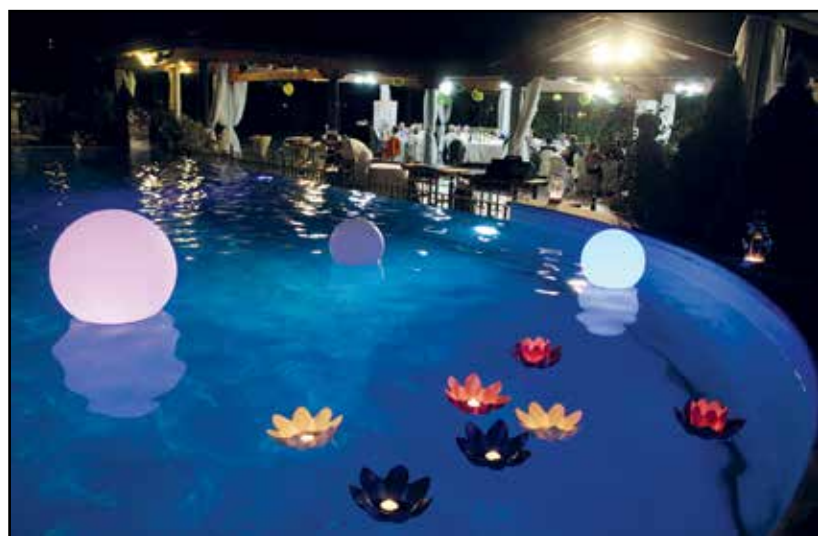
Suggestiva immagine di una serata di gusti e colori.

Una importante novità il nuovo ingresso del Green Park arricchito da tre splendide fontane con una coreografia di colori e di verde, un colpo d'occhio sicuramente piacevole.