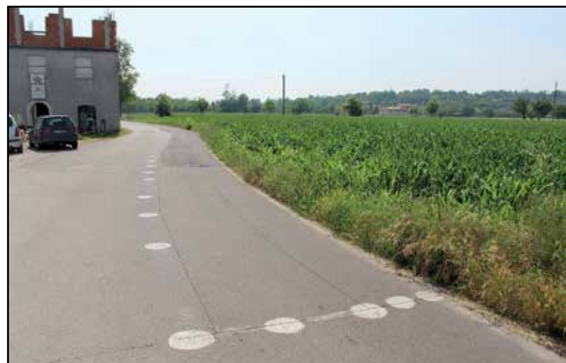
L'inizio della intricata questione della viabilità.

Il collegamento fra le due strade vicinali, per rendere più agevole l'arrivo alle Fontanelle, realizzato alcune decine di anni fa rientra fra le situazioni da sanare, così come il nuovo tratto di strada realizzata solo pochi anni or