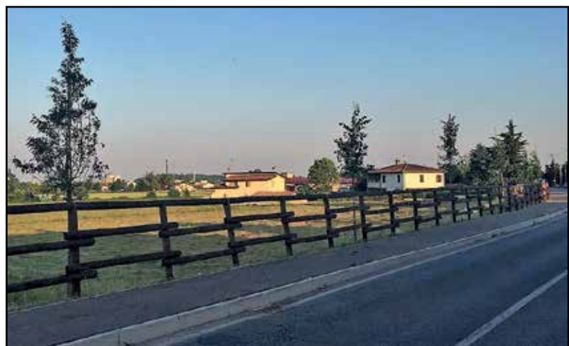
Il tratto di via S. Giovanni.