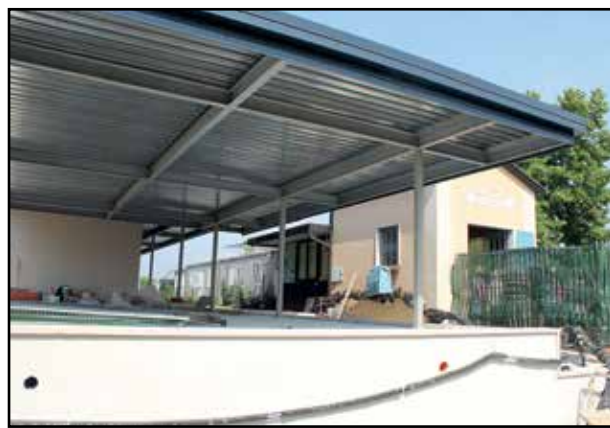
Lavori in corso per sostituire gli edifici abusivi.